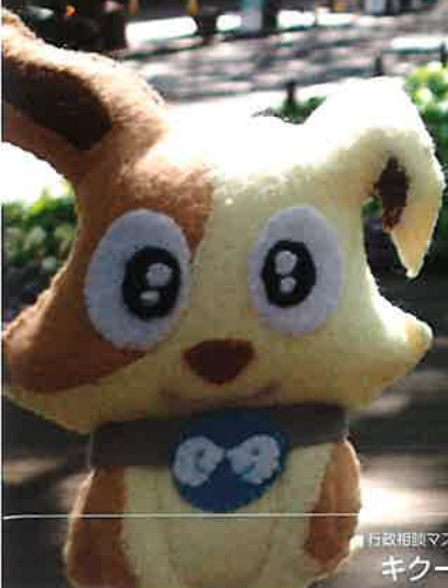
行政相談マスコット キクーン