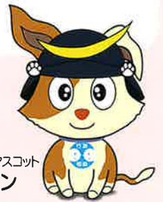
行政相談マスコット キクーン